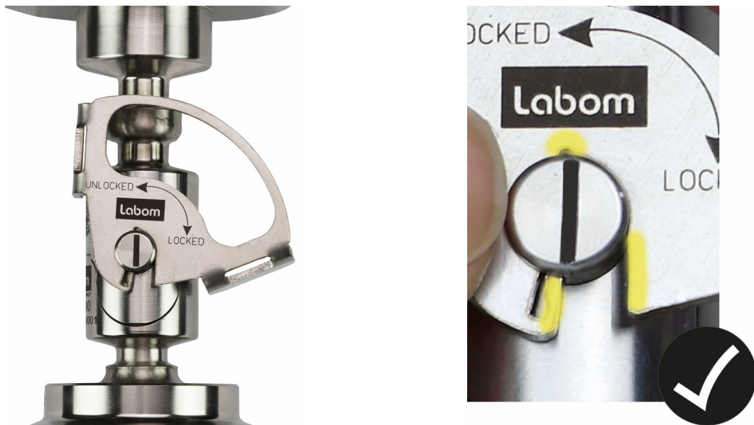
Abbildung 2: Verbindungsbügel sitzt richtig auf

Stecken Sie dazu den Bügel von der Messgeräteseite her auf. Die Flügel müssen nach hinten zeigen. Das Labom-Logo muss sichtbar sein.