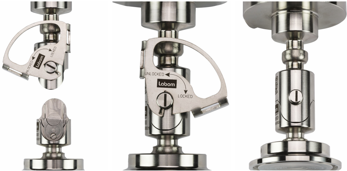
Abbildung 7: Darstellung vor und nach dem Verbinden sowie nach Abnehmen des Verbindungsbügels

Entfernen Sie den Verbindungsbügel, um ein versehentliches Betätigen zu vermeiden.