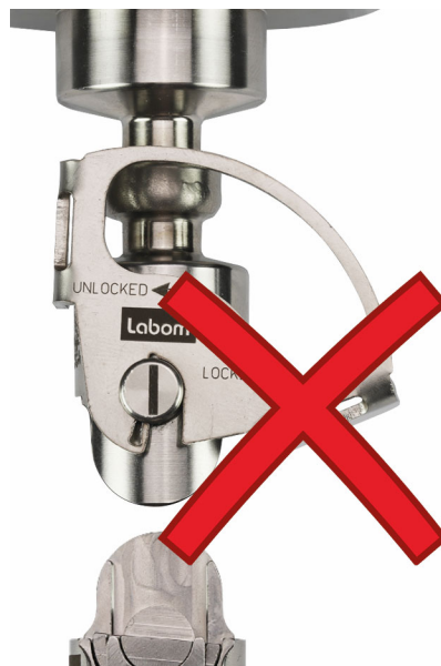
Abbildung 5: Unzulässige Bügelstellung im getrennten Zustand