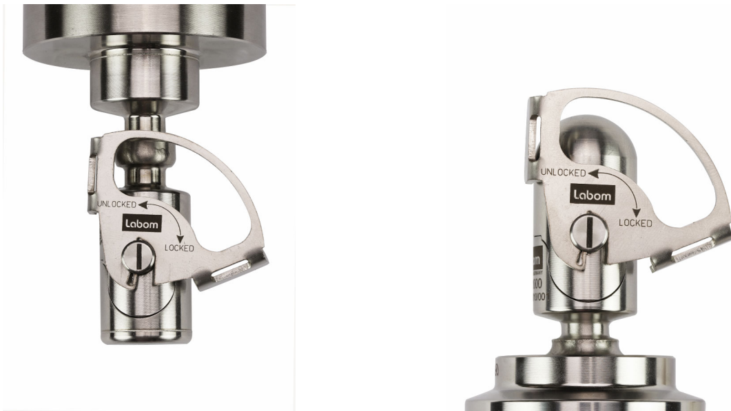
Abbildung 6: Messgerät und Druckmittler mit jeweiliger Schutzkappe

In diesem Zustand können Messgerät und Druckmittler gefahrlos montiert, transportiert oder gelagert werden.