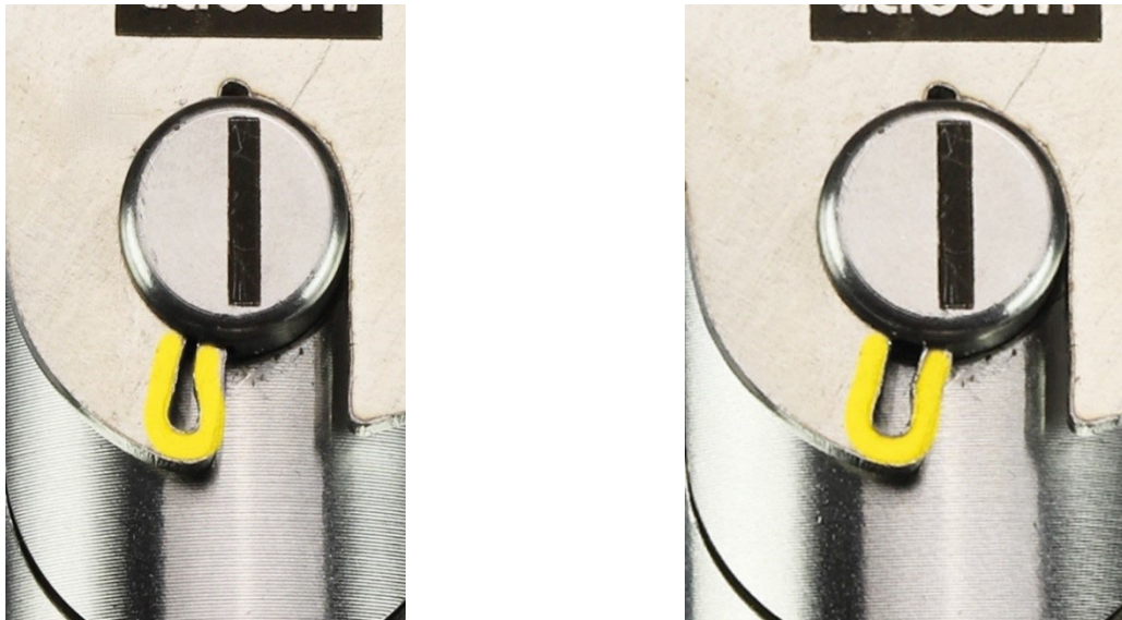
Abbildung 9: Ansicht vor und nach Verbiegen der Federlasche (entscheidender Bereich gelb hervorgehoben)