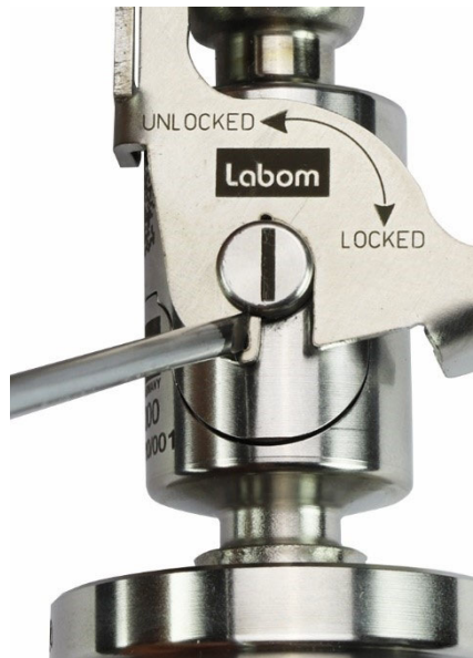
Abbildung 8: Sichern gegen Verlust des Bügels