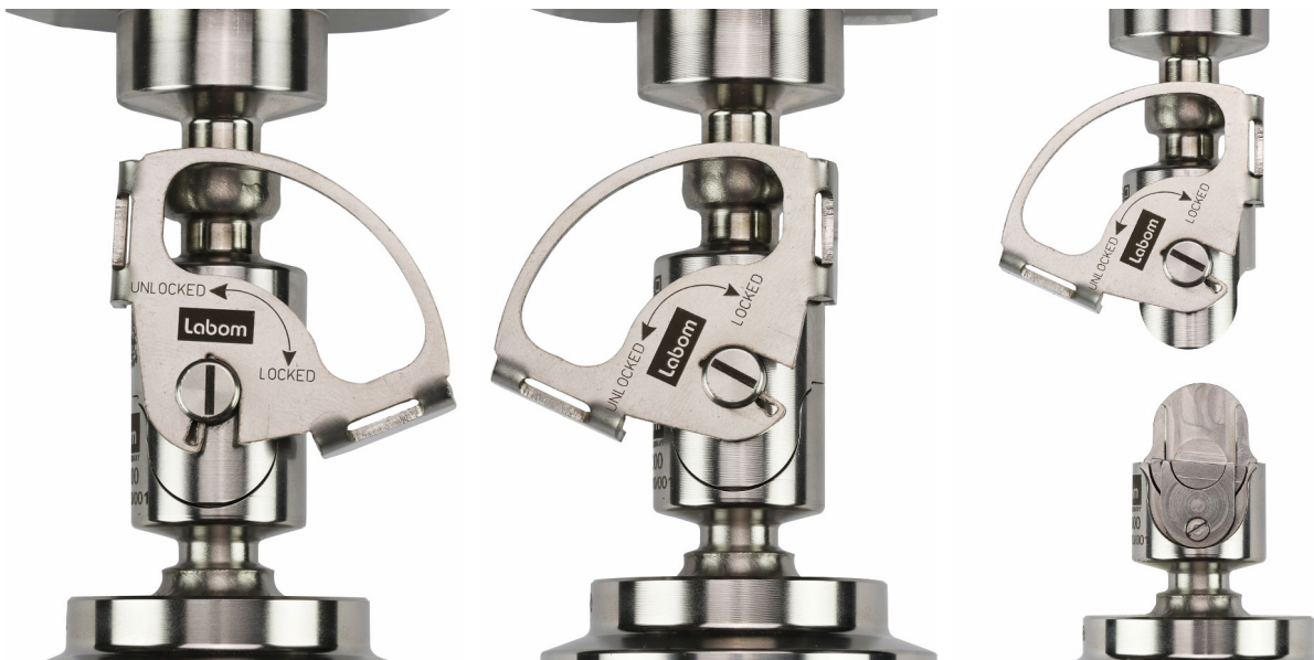
Abbildung 4: REconnect Schnellkupplung im verbundenen, entriegelten und getrennten Zustand

Die hydraulische und mechanische Verbindung ist nun gelöst. Das Labom-Logo als auch der Positionsanzeiger auf der Verbindungsachse stehen nun schräg. In dieser Position kann die Schnellkupplung durch Auseinanderziehen in axialer Richtung getrennt werden.