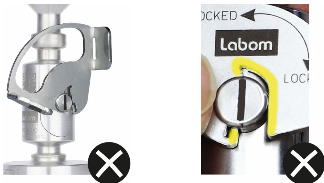
Abbildung 3: Verbindungsbügel sitzt falsch auf